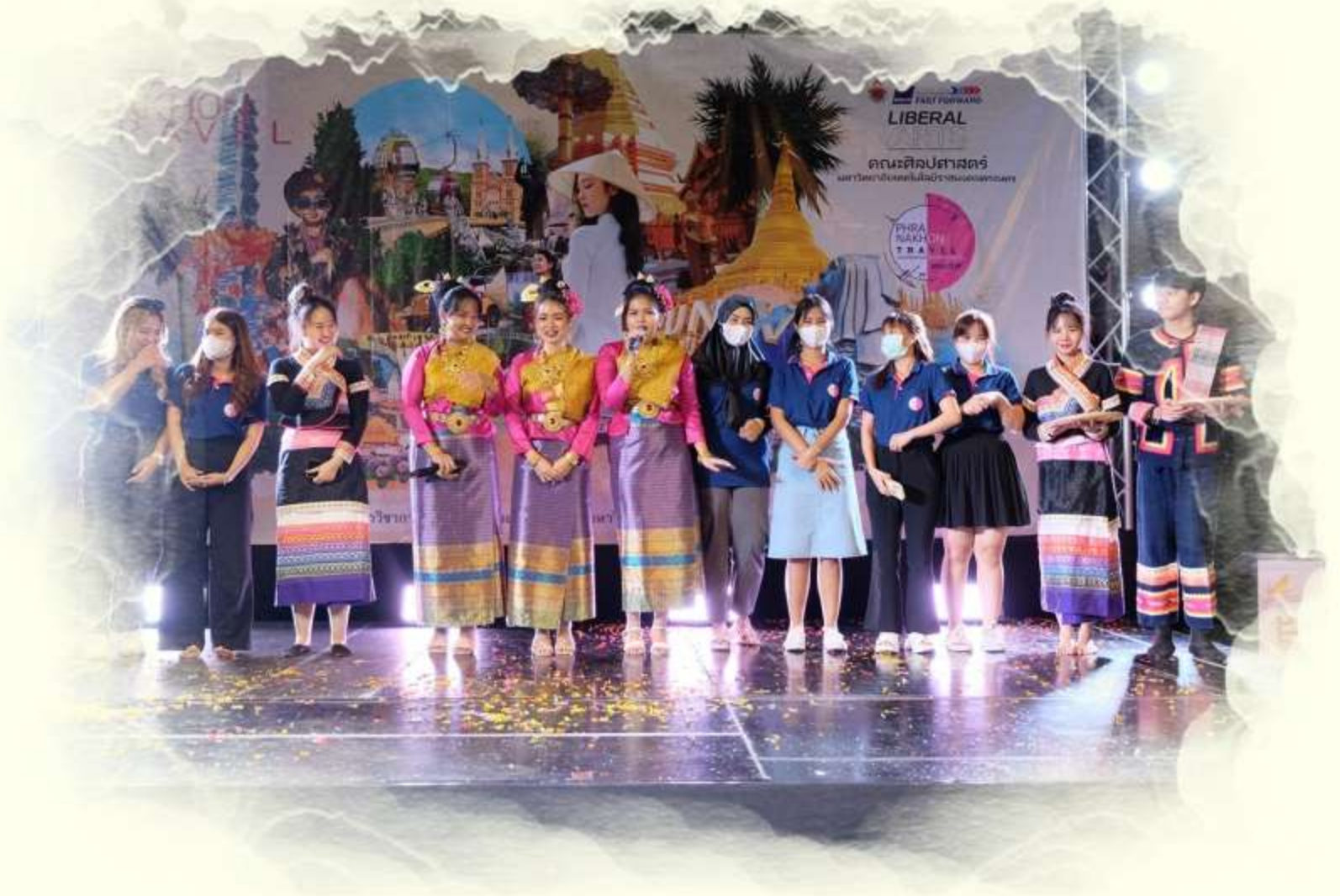
โปรแกรมที่ 9 สิงคโปร์