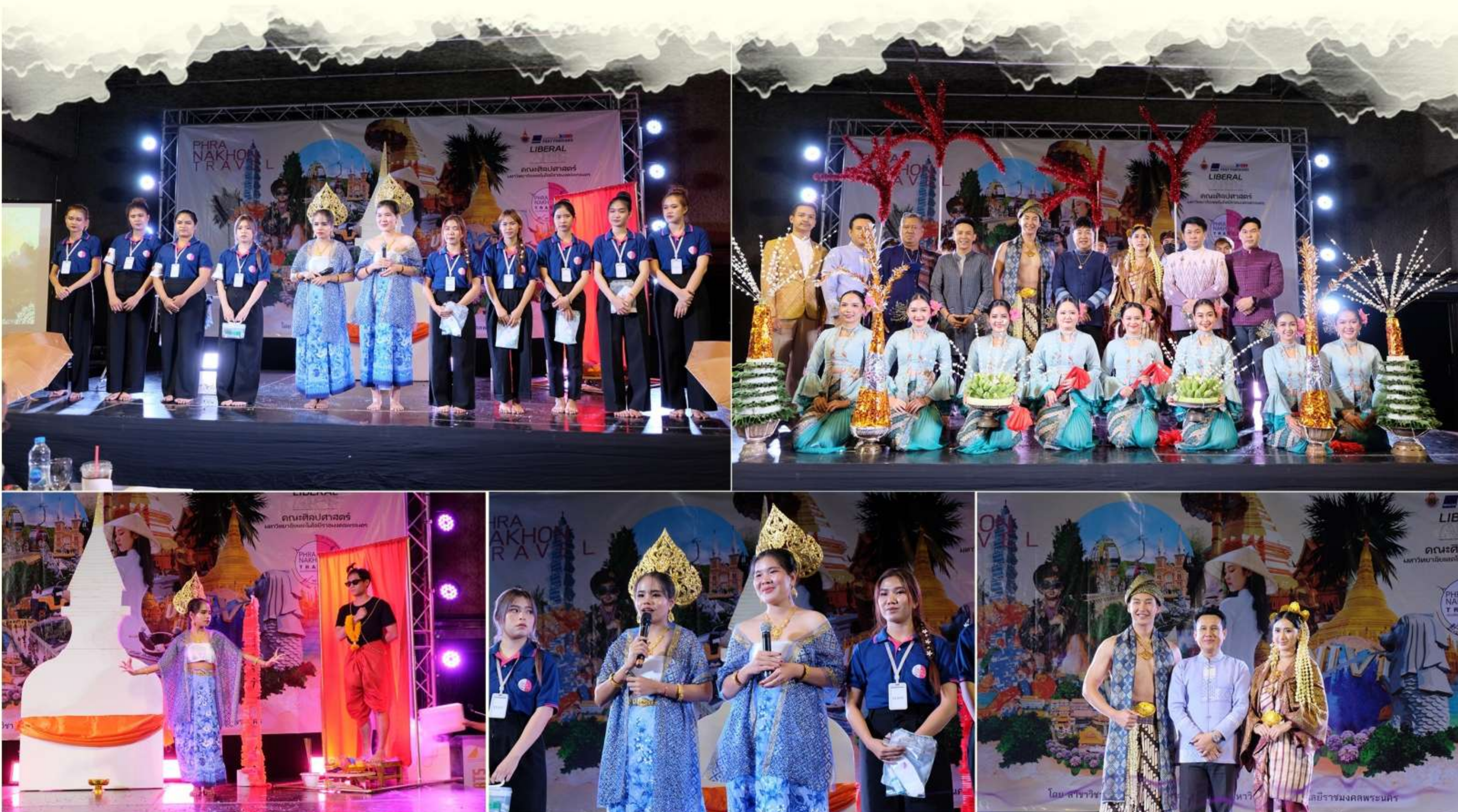
#RMUTP@Liberal Arts Fast Forward