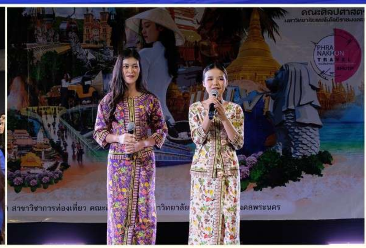
: งานสื่อสารองค์กร คณะศิลปศาสตร์ มหาวิทยาลัยเทคโนโลยีราชมงคลพระนคร